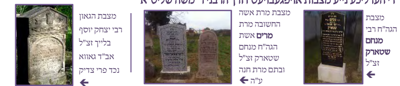
די הערליכע נייע מצבות אויפגעבויעט דורך הרבני ר' משה שליט"א

היות א חלק ביה"ח איז געווען נישט ריכטיג דאקומענטירט איז אפגעהאלטן געווארן דאס פארענדיגן פונעם בנין הגדר. אצינד איז ערווארטעט אז די אלע פארמאליטעטן וועלן בס"ד געלייזט ווערן און בקרוב וועט מען זוכה זיין לגמור בכי טוב.